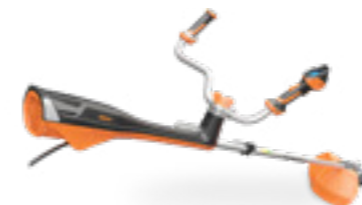
EXCELION 2 DH + TAP CUT 3