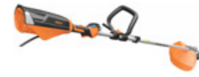
EXCELION 2 LH + TAP CUT 3