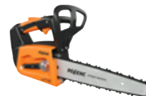
SELION C21 HD EVO

*Das Angebot gilt für 4 Jahre ab Kauf und Inbetriebnahme des Geräts, vorbehaltlich: - der Inbetriebnahmeerklärung für den Akku/das Werkzeug - jährlicher Wartung mit Originalersatzteilen im Netzwerk der zertifizierten PELENC-Händler - Hochladen der Wartungsrechnung durch den Händler auf dem Serviceportal (Ausgenommen sind Vorführ- und Gebrauchtgeräte.)