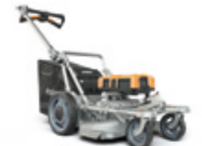
RASION SMART 2