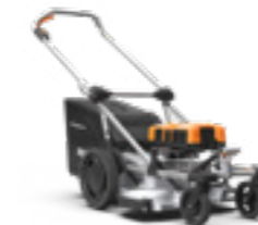
RASION EASY 3