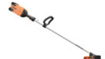
EXCELION ALPHA + ALPHA CUT