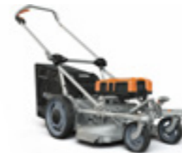
RASION EASY 2

Für die folgenden Produkte bieten wir Ihnen eine kostenlose Garantieverlängerung auf insgesamt 4 Jahre* an, sofern eine einmalige Inbetriebnahme und eine jährliche Wartung erfolgt.