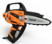
SELION 12 EVO