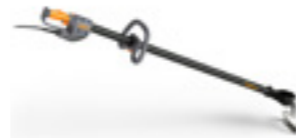
CULTIVION (AUSSER ALPHA)